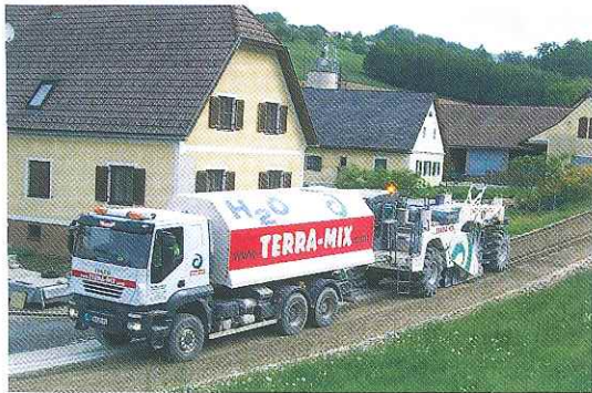
Рис. 7. TERRA-MIX — разработчик широко используемой в Западной Европе технологии санации дорожных покрытий

по уже реализованным проектам, на основании предоставленной заказчиком информации подобрать оптимальные параметры технологии. Тем более, что, несмотря на общее название — «импульсное уплотнение», в арсенале TERRA-MIX Bodenstabilisierungs GmbH немало разновидностей и вариаций этой технологии.