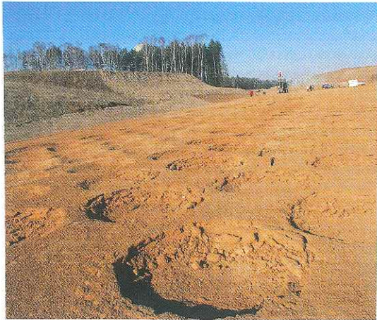
Рис. 2. Расстояние между точками в растровой сетке, а также количество проходов выбираются индивидуально для каждого проекта.

В России в дорожном строительстве для этих целей используют главным образом дорожные катки. Но возможности катков ограничены. И вовсе не качеством самих машин (оно у многих компаний очень высокое), а конструктивными особенностями этого вида технических устройств.