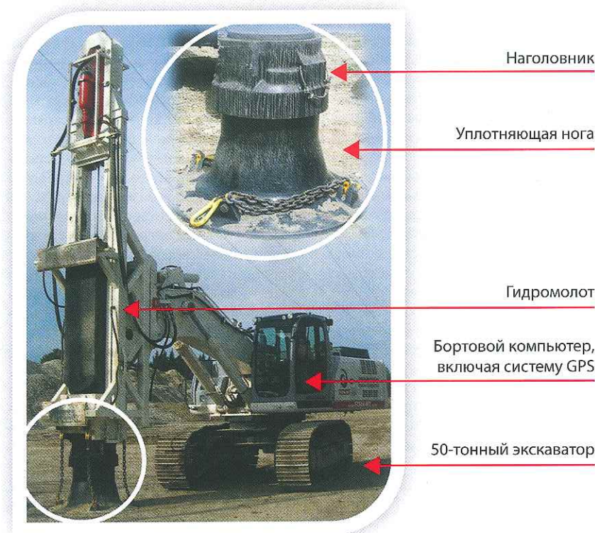
Рис. 5. Состав производственно-технологического комплекса, используемого в системе TERRA-MIX

Расстояние между точками в растровой сетке, а также количество проходов подбираются индивидуально для каждого проекта. После проведения уплотнения на калибровочном поле и анализа взятых проб методом зондирования задаются новые параметры. Современное программное обеспечение позволяет контролировать производительность и качество выполненных работ. Контроль — это вторая, очень сильная сторона метода импульсного уплотнения.