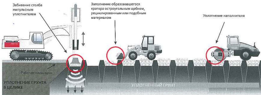
Рис. 4. Импульсное уплотнение с дополнительным материалом