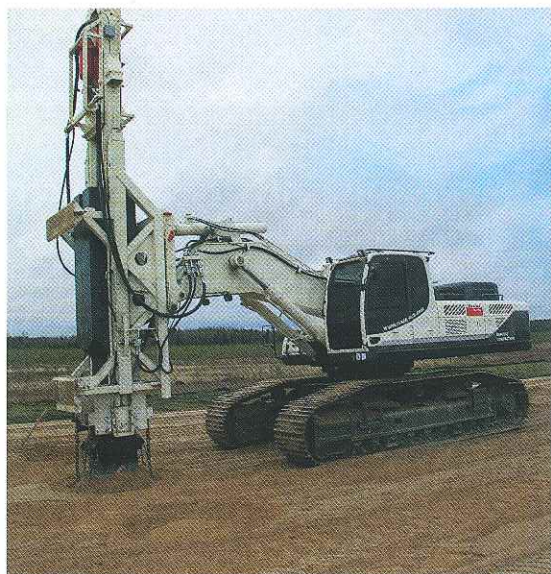
Рис. 1. Импульсное уплотнение TERRA-MIX даёт возможность надёжного, экономичного и быстрого улучшения основания

В промышленном и гражданском строительстве широко используются виброуплотнение, замена почв, буровые или забивные сваи, струйная цементация (т. н. Jet Crouting) и т. д.