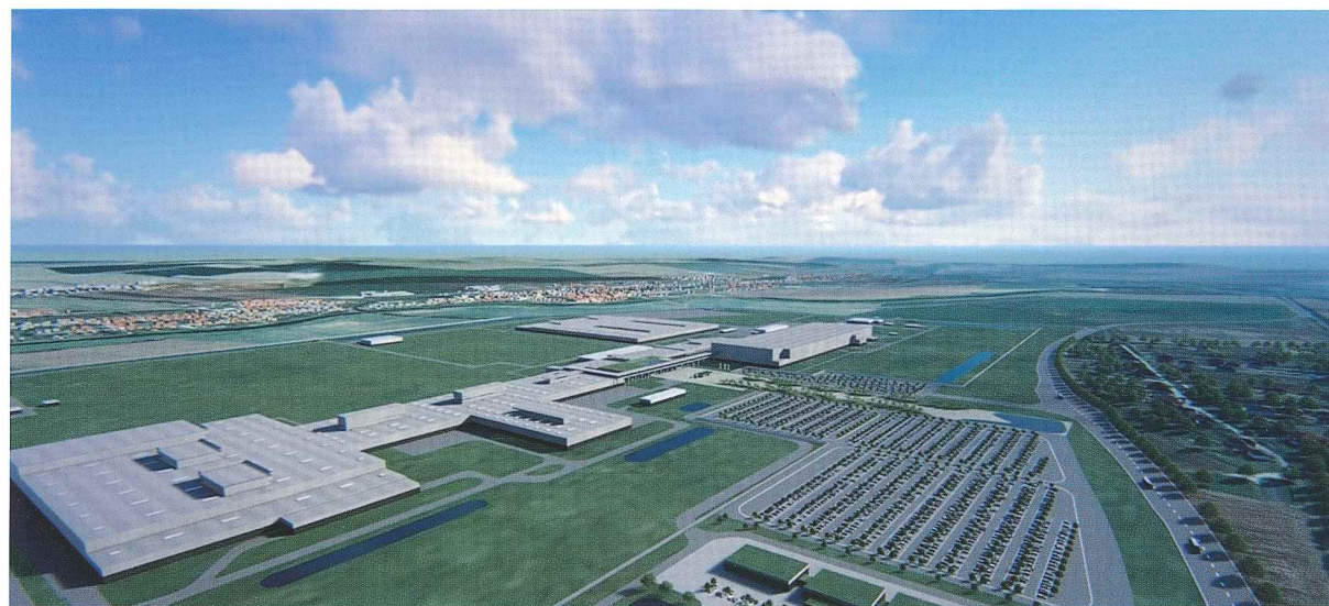
Automobilfabrik Jaguar Land Rover

Jaguar Land Rover hat sich dazu entschieden, ein neues Automobilwerk zu bauen. Es wurden mehrere Standorte in Kontinentaleuropa für den Bau des Werkes geprüft. Letztendlich fiel die Wahl auf die Stadt Nitra in der Slowakei, wo das Werk auf einem 1.800.000 m 2 großen Grundstück gebaut wird. Dieses neue Werk hat eine Kapazität von jährlich 150.000 Fahrzeugen und wird bis zu 2.800 Mitarbeiter beschäftigen.