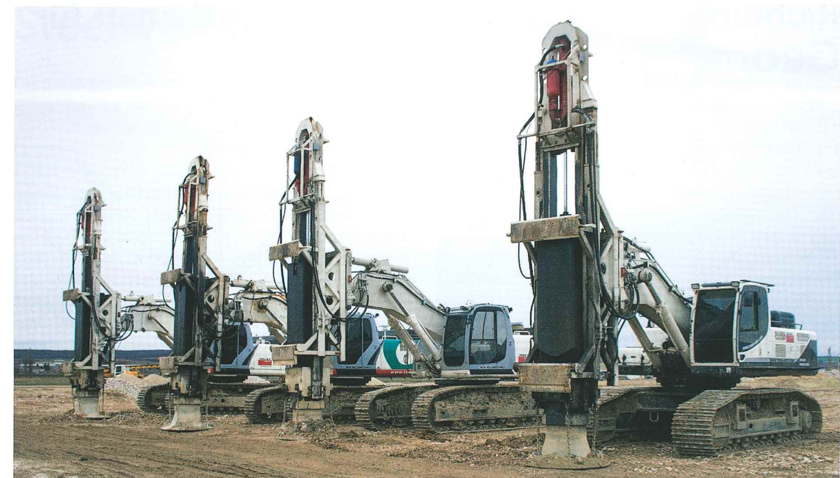
Impulsverdichter bei der Arbeit

Die Ergebnisse der Testfelder haben gezeigt, dass sowohl das System der Rüttelstopfverdichtung als auch die Impulsverdichter-Kiessäulen von TERRA-MIX für die Baugrundverbesserung dieses Bauvorhabens gut geeignet sind. Um den kurzen Bauzeitplan einhalten zu können, beauftragte der Auftraggeber für ca. 50% der Fläche die ARGE KELLER – BAUER zur Herstellung von Rüttelstopfsäulen und für die restlichen 50% der Fläche die Fa. TERRA-MIX zur Herstellung der Impulsverdichter-Kiessäulen.